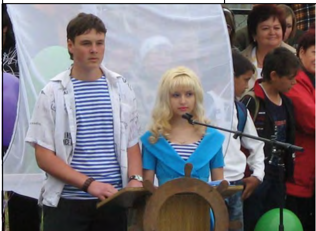
Ведущая «Последнего звонка – 2008»