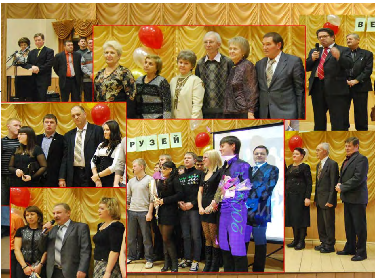
Традиционная встреча поколений – «День выпускников в Красном Яре» - собрала сотни бывших выпускников.