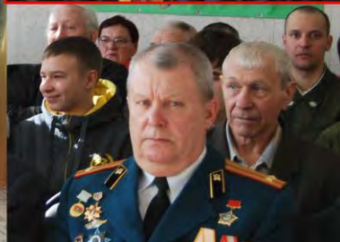
Знаковые события февраля: встреча трёх поколений в Красноярском ОДП и 80-летие районной газеты «Красноярские новости»