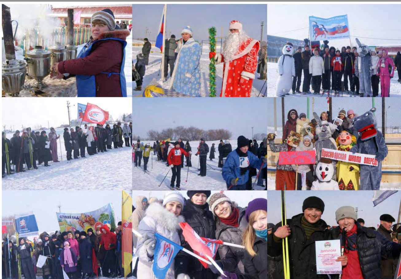
Участников массовых лыжных состязаний сильный мороз не испугал. Был поставлен своеобразный рекорд хорошего настроения и задора.

Все фотографии этих и других событий смотрите на нашем молодёжном сайте.