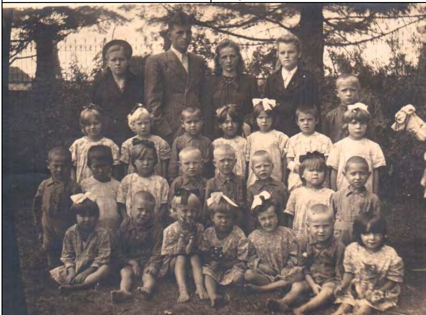
Прабабушка в верхнем ряду крайняя слева.