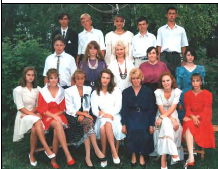
В кругу учеников и коллег...