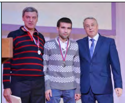
Награждаются представители футбольной команды «Надежда»