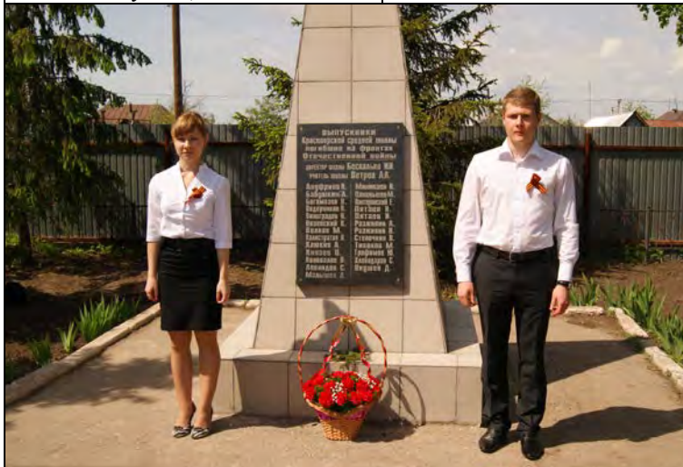
Обелиск перед зданием Красноярской школы