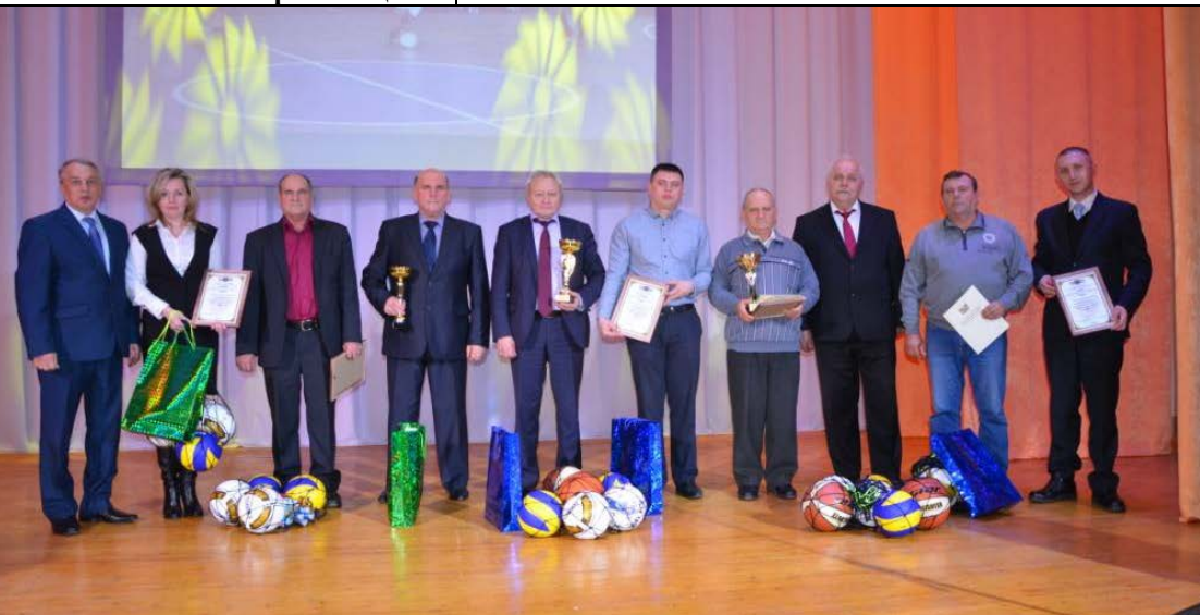
Все начинается с массового спорта. На первом месте сельское поселение Красный Яр