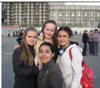
Активные - творческие