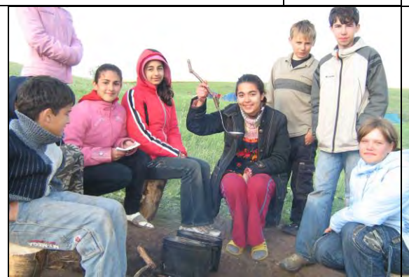
Активные - на турслете – 2008.