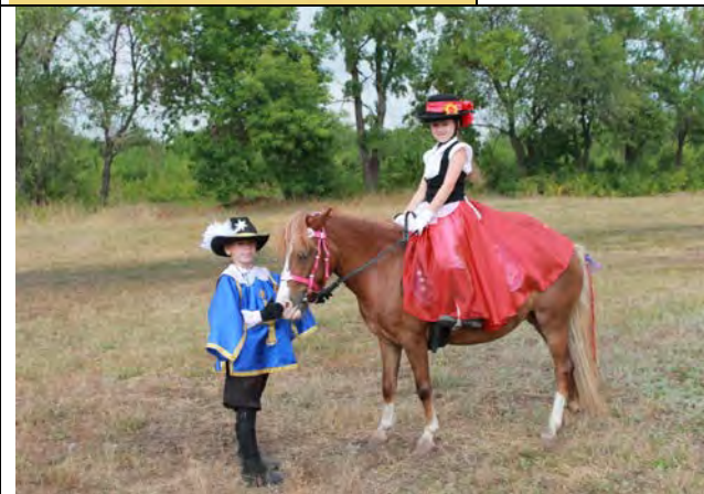
Чемпионат и первенство Самарской области по конному спорту (выездка), август 2013г., Самарская обл., г.Тольятти