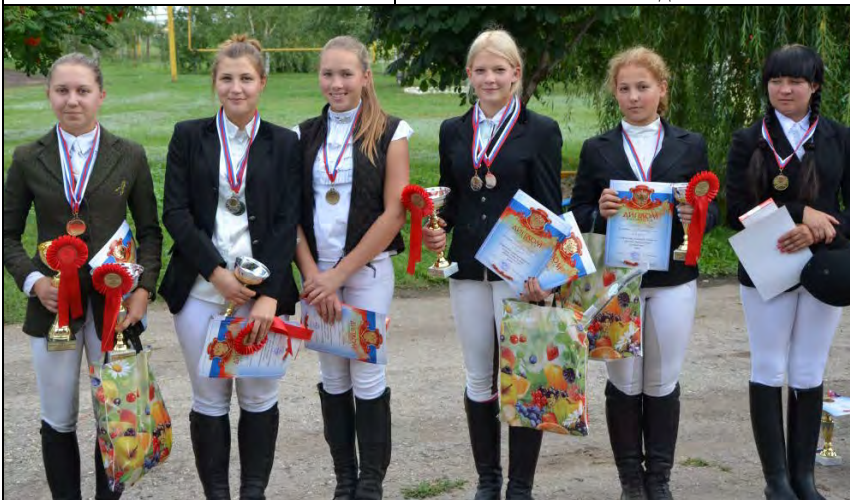
Кубки и дипломы – замечательный итог областных состязаний