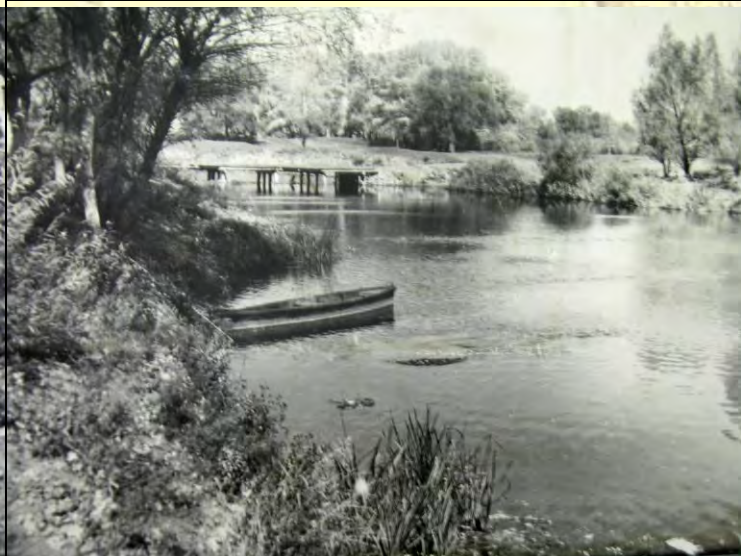
Так выглядел «пьяный мост»