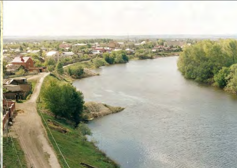
А такой вид открывается на село