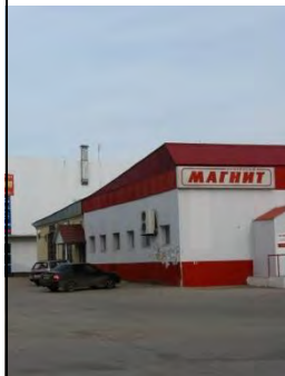
Новое и старое лицо улицы Кооперативной