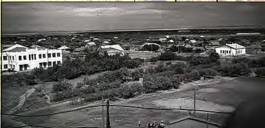
Так выглядела центральная площадь села 40-50 лет назад