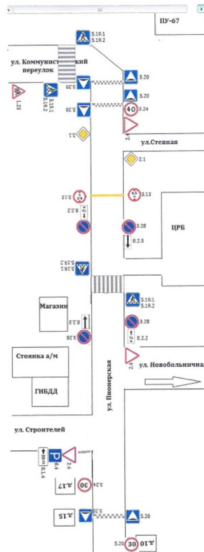
Пионерская 10 – Коммунистический переулок