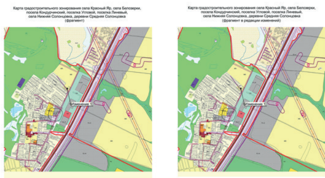
Применение 2 в Карте градостроительного зонирования сельского поселения Красный Яр муниципального района Красноярский Самарской области (М 1:10000) и в Карте градостроительного зонирования сельского поселения Красный Яр муниципального района Красноярский Самарской области (М 1:25000)

Примечание: 1. Изменение отображения границ земельных участков в границах территории, в отношении которой вносятся изменения зонирования, осуществлено в соответствии с данными о границах земельных участков, содержащимися в ЕГРН.