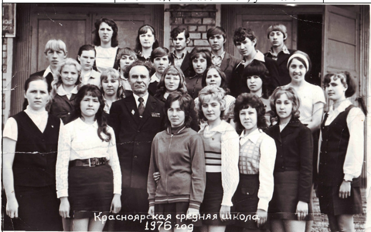
Красноярская средняя школа, 1976 год