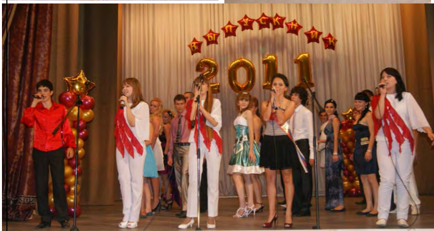
Прощальная дископрограмма на спорткомплексе «Сок»