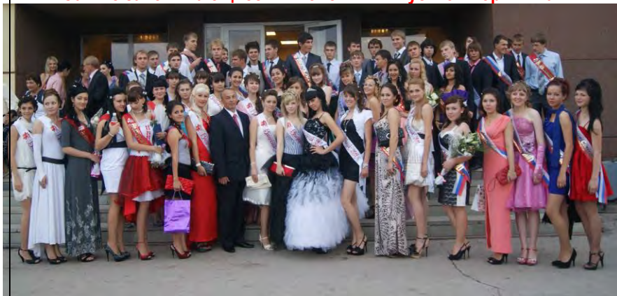
Торжество в районном Дворце культуры «Мечта»

Самые запоминающиеся мгновения выпускной поры – 2011