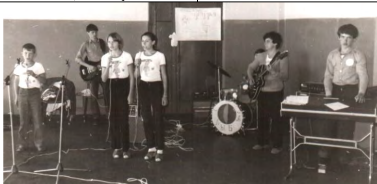
Выступление в лагере «Маяк» - 1980 г.