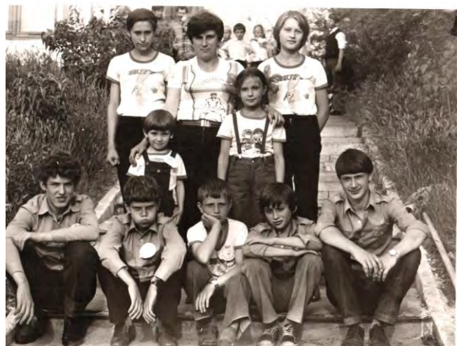
Первый состав "Улыбки"