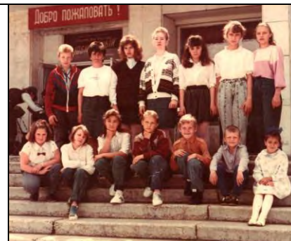
Последний состав «Улыбки» - 1990 г.

- У нас случилось такое, что мальчики после 9 класса ушли, и некому было играть остались одни девочки, так они не сдались, за лето переквалифицировались из певуний начали играть, и одни девочки выступали, и мы заняли 2 место. Ансамбль «Улыбка» единственный, который был