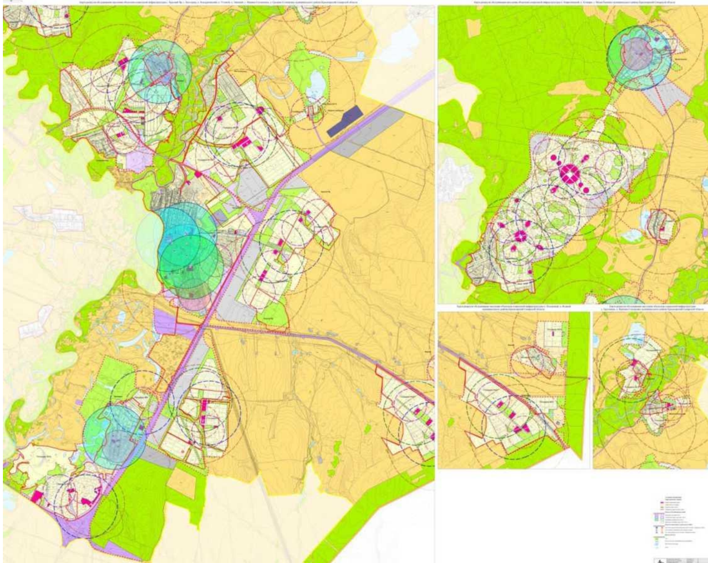
Рисунок 3- Радиусы обслуживания с.п. Красный Яр объектами социальной инфраструктуры