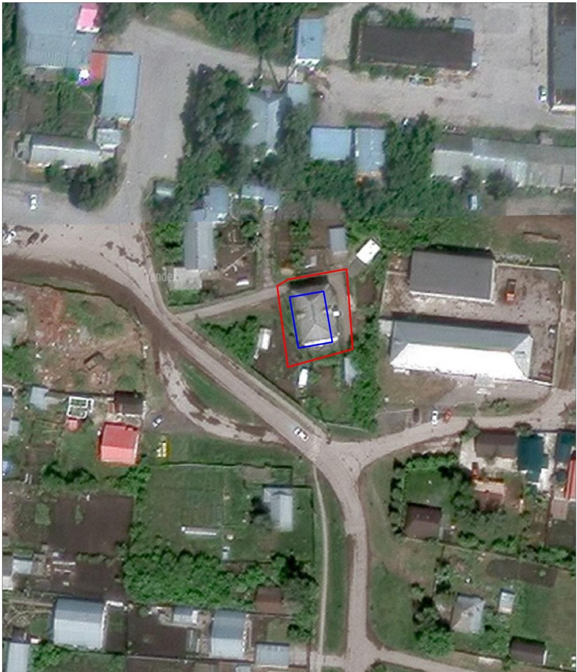
Схема земельного участка под многоквартирным домом, расположенным по адресу: Самарская область, Красноярский район, с. Красный Яр, ул. Пионерская, д. 67