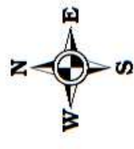
Схема границ территории разработки документации по проекту планировки территории и проекту межевания территории объекта строительства АО "Самаранефтегаз" № 6100 «Техническое перевооружение АГЗУ № 425 Белозерско-Чубовского месторождения" расположенный на территории муниципального района Красноярский Самарской области в границах сельского поселения Красноярый Яр