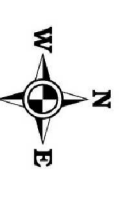
Схема согласования места размещения объекта АО "Самаранефтегаз": 5530П "Система размещения скв. №8007 Белозерско-Чибовского месторождения", на территории муниципального района Красноярский в границах сельского поселения Красный Яр

Схема согласования места размещения объекта